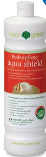
aqua shield Bodenpflege für versiegelte Parkettböden und beschichtete Oberflächen

Mit clean & green aqua shield erstrahlt der Boden in neuem Glanz. Zusätzlich wird die Strapazierfähigkeit der Oberfläche erhöht und vor eindringender Feuchtigkeit von oben geschützt.