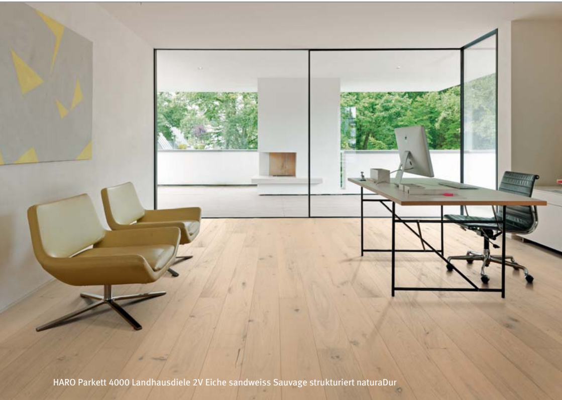
HARO Parkett 4000 Landhausdielen 2V Eiche sandweiss Sauvage strukturiert naturaDur

Hamberger Flooring GmbH & Co. KG Postfach 10 03 53 83003 Rosenheim Deutschland