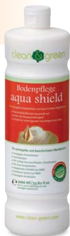
Bodenpflege aqua shield

Schnell, einfach, natürlich – Pflege für alle Böden