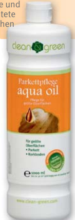
Parkettpflege aqua oil