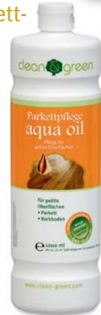
aqua oil Parkettpflege

Zur Auffrischung/Renovierung von strapaziertem, geöltem, schwarzen Parkett empfehlen wir aqua oil black. Für weiß geöltes Parkett empfehlen wir aqua oil white.