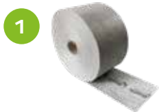
1 ARDATEPE 120 EXTRA SPEZIALDICHTBAND Produktinformationen auf Seite 21.