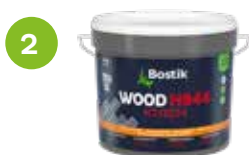
2 WOOD H944 XTREM HYBRID-VIELZWECKKLEBSTOFF Produktinformationen auf Seite 22.