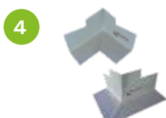
4 ARDATEPE INSIDE/OUTSIDE SPEZIAL-INNEN UND AUSSENECKEN Produktinformationen auf Seite 22.