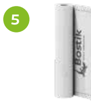
5 ARDATEC MEMBRAN FLEXIBLE ABDICHTUNGS- UND ENTKOPPLUNGSBAHN Produktinformationen auf Seite 22.