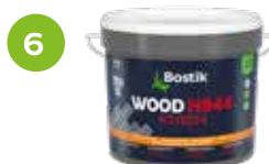
6 WOOD H944 XTREM HYBRID-VIELZWECKKLEBSTOFF Produktinformationen auf Seite 22.